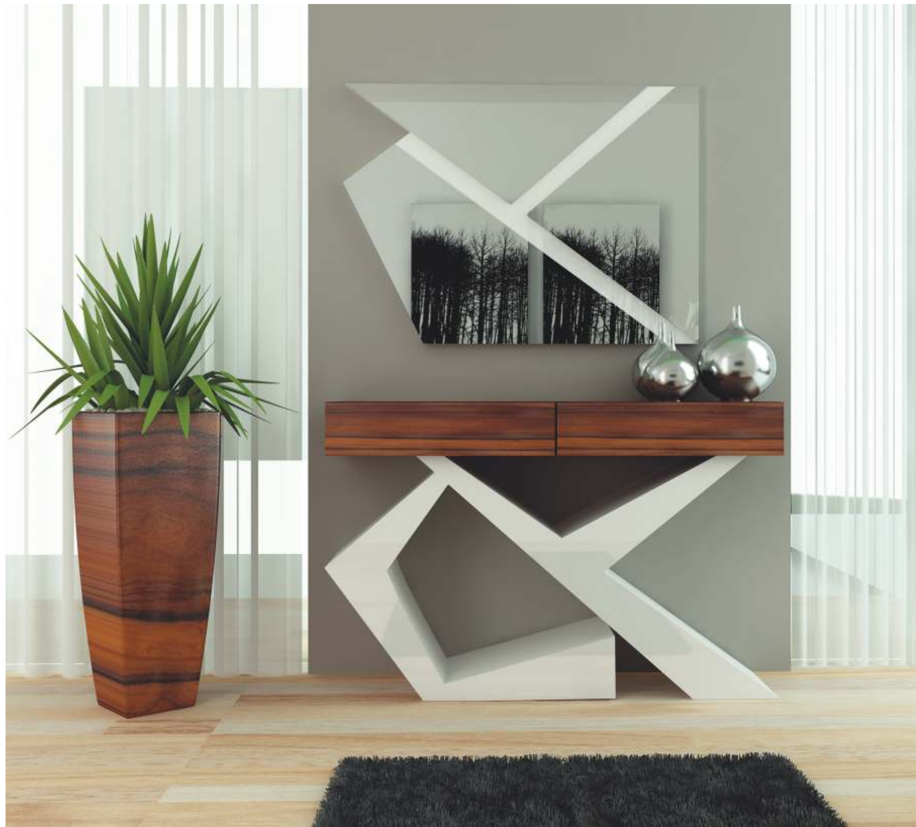
REF: CY01 DIM.: 1300 x 375 x 850 mm