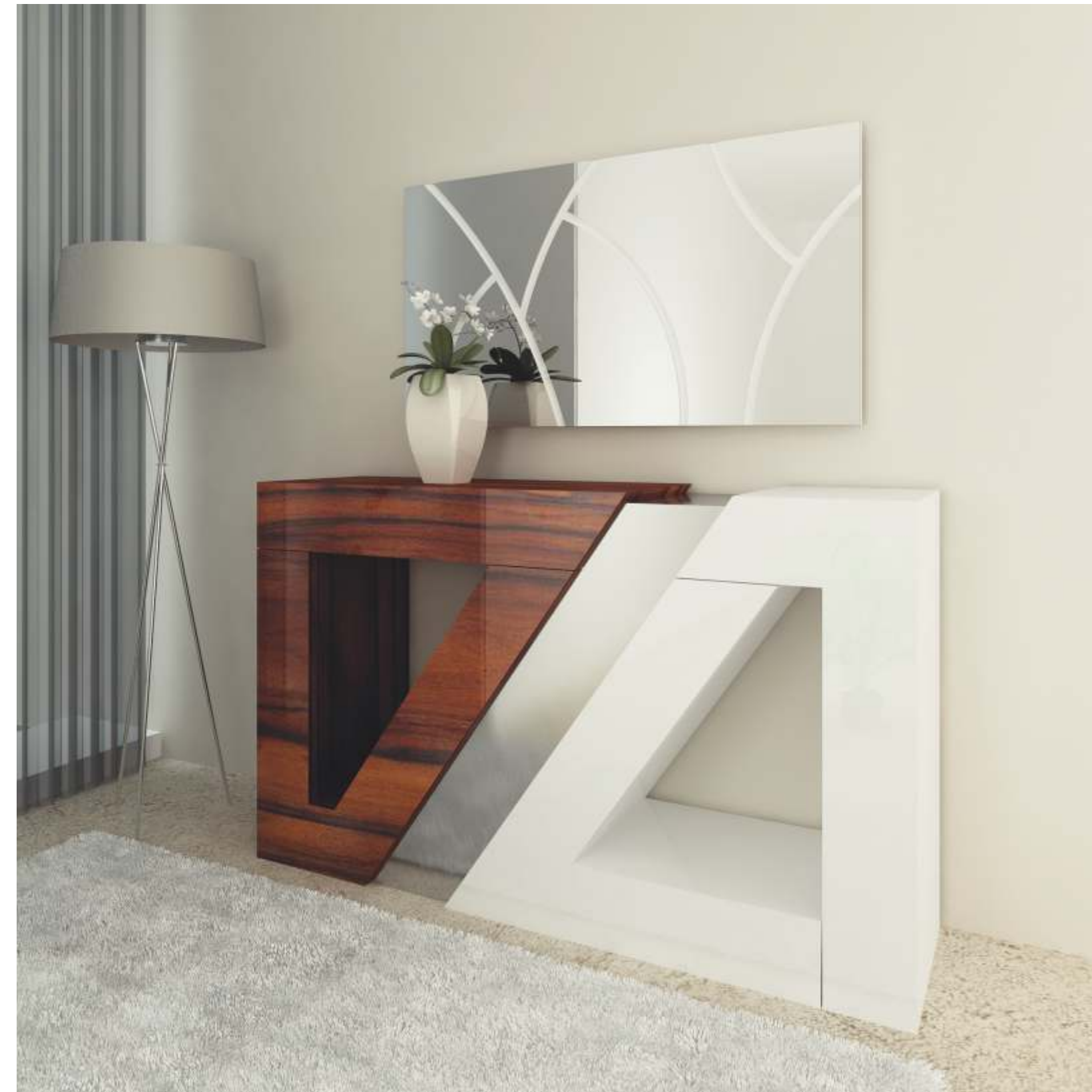
REF: QD01 DIM.: 1400 x 370 x 850 mm