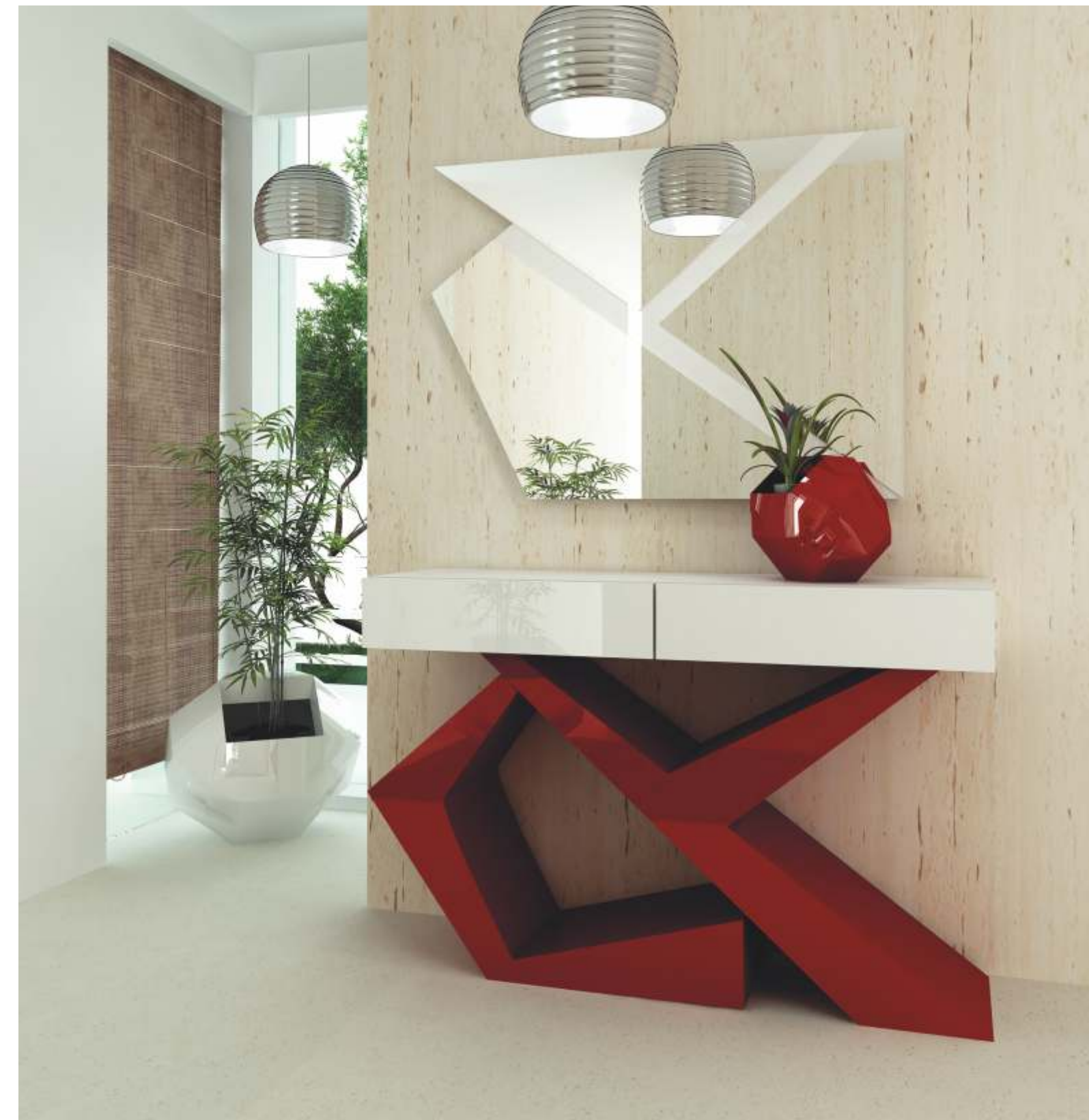
REF: CY01 DIM.: 1300 x 375 x 850 mm