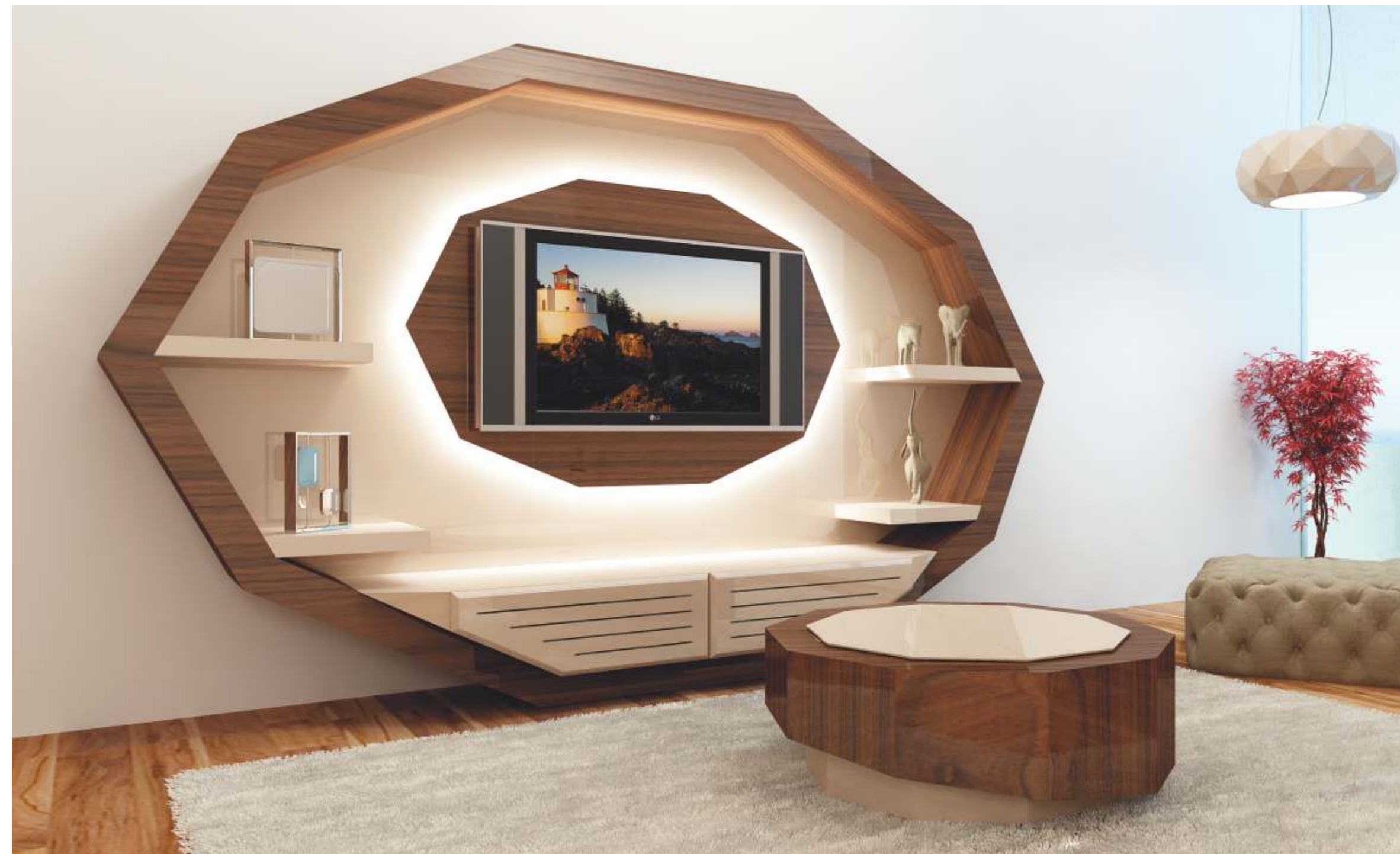
REF: HP01 DIM.: 3000 x 510 x 1900 mm