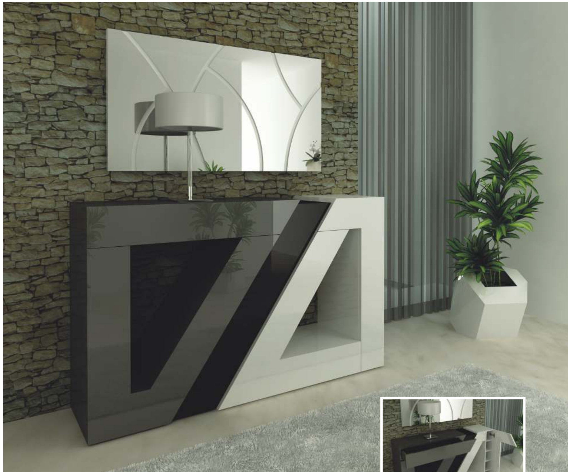
REF: QD01 DIM.: 1400 x 370 x 850 mm