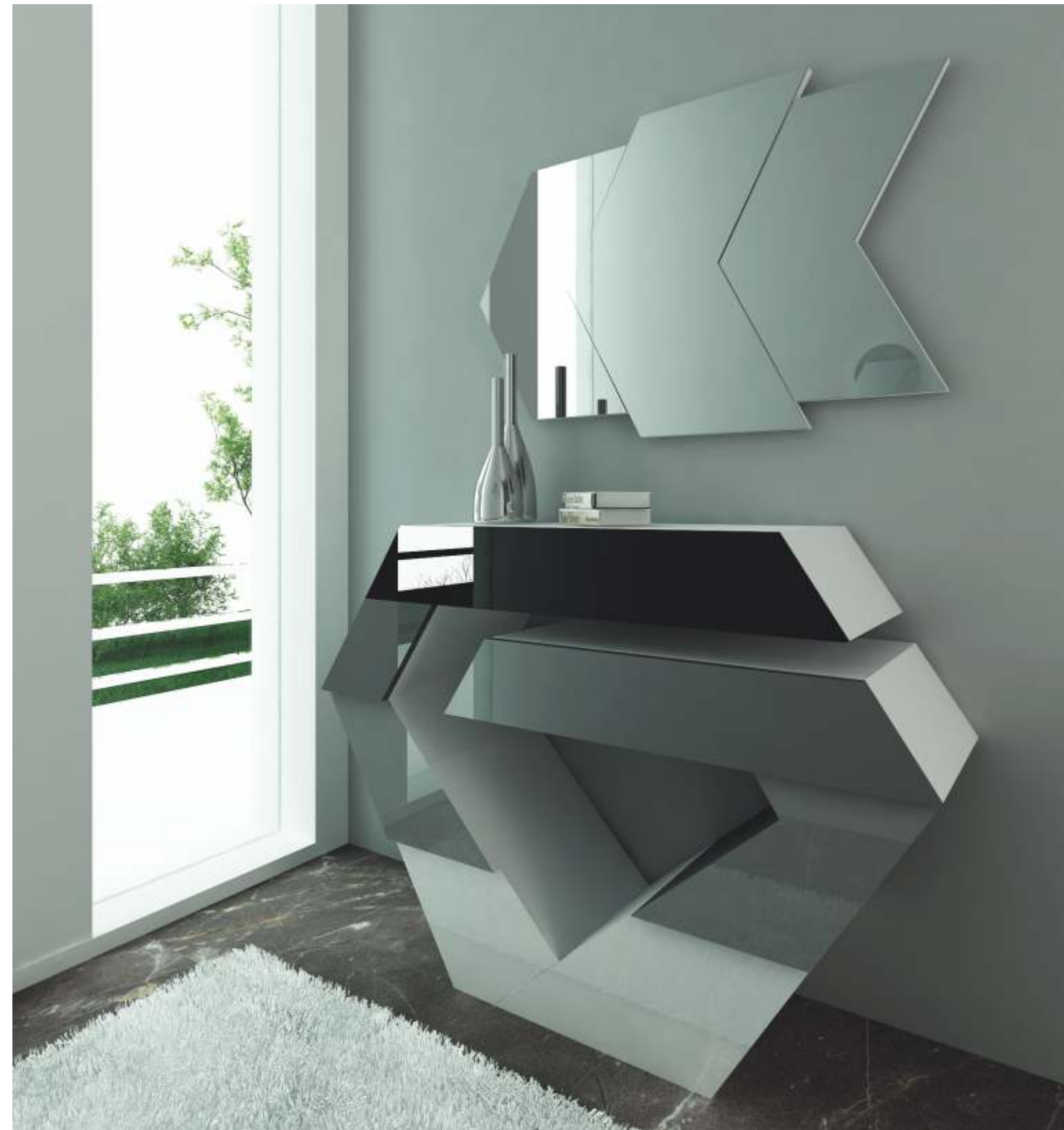
REF: PT01 DIM.: 1200 x 900 x 370 mm