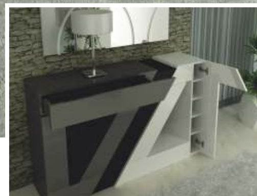
REF: QD02 DIM.: 1100 x 25 x 600 mm