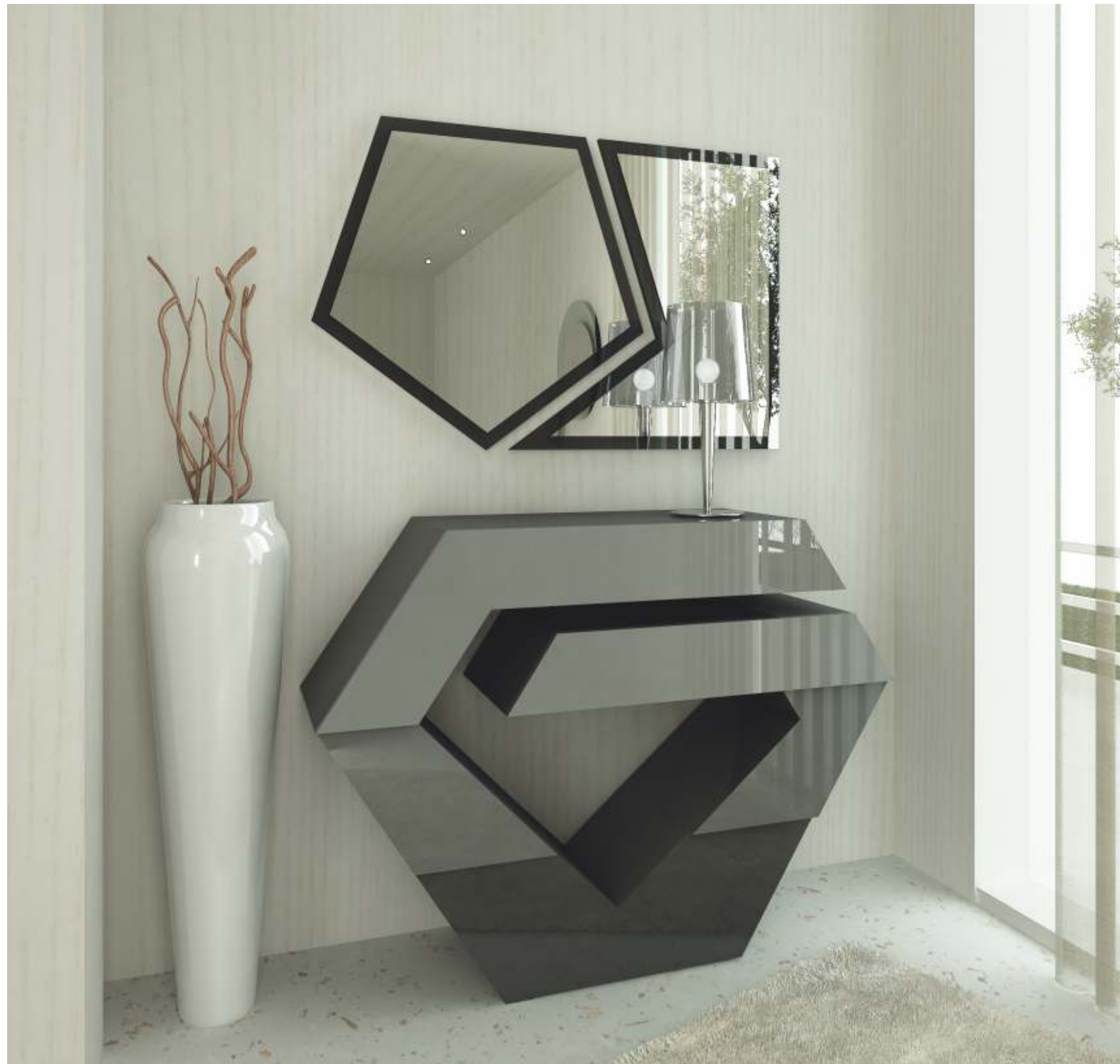
REF: PT01 DIM.: 1200 x 900 x 370 mm