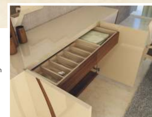
REF: FT17 DIM.: 1490 x 25 x 1000 mm