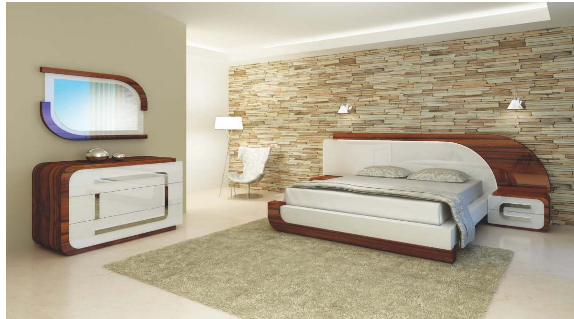
REF: FT33 DIM.: 1135 x 50 x 700 mm