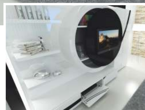
REF: FT01 DIM.: 3400 x 585 x 2190 mm