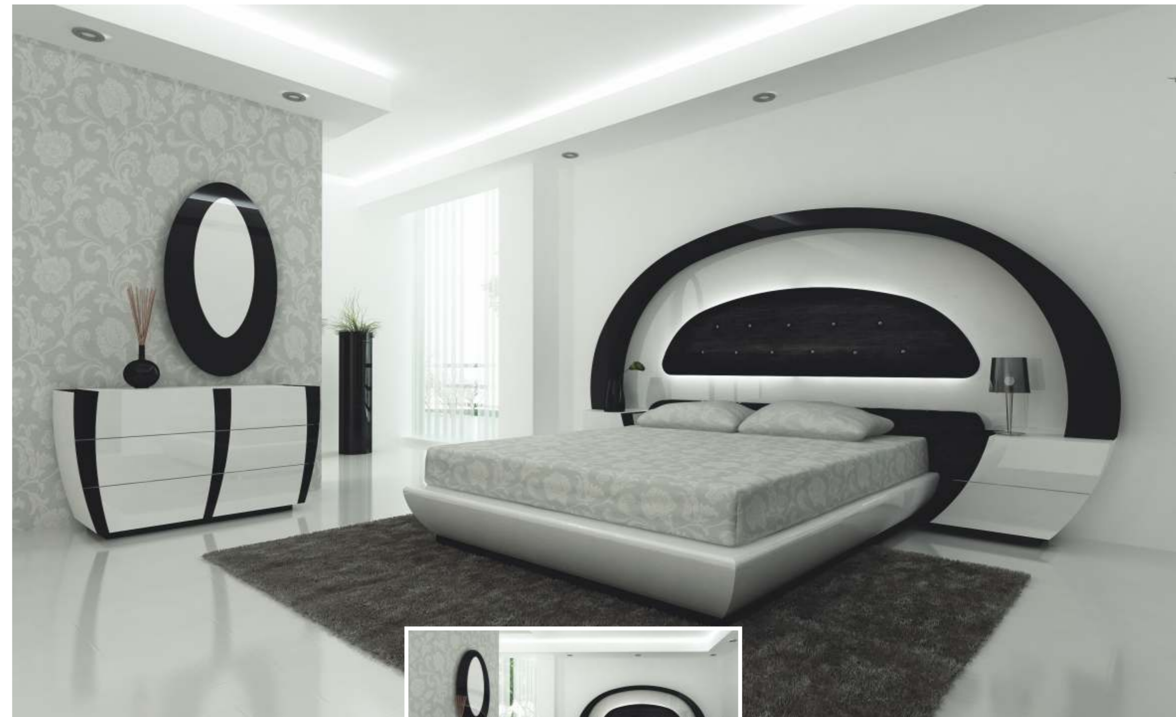
REF: FT27 DIM.: 700 x 25 x 1300 mm