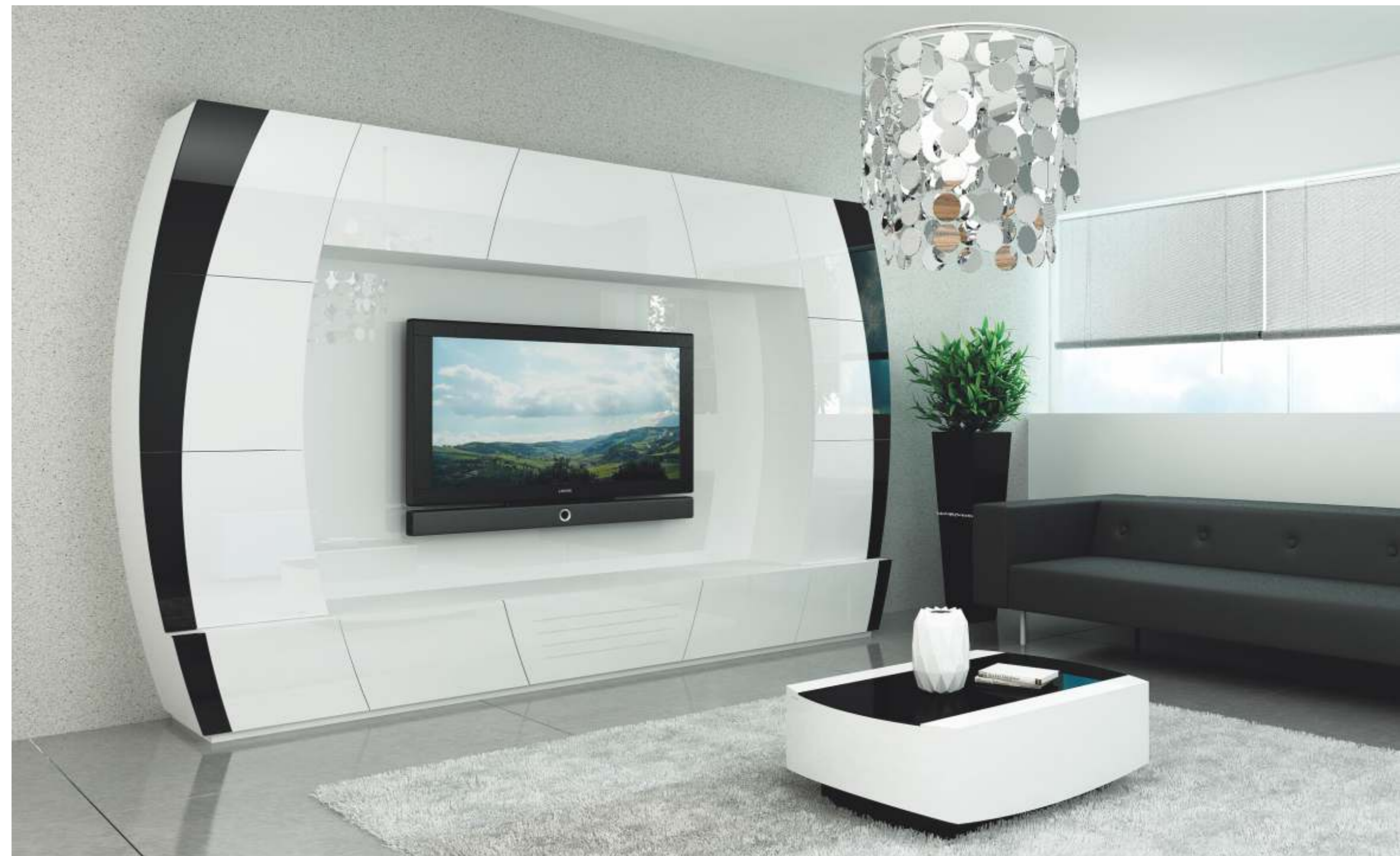
REF: FT04 DIM.: 3000 x 450 x 1900 mm