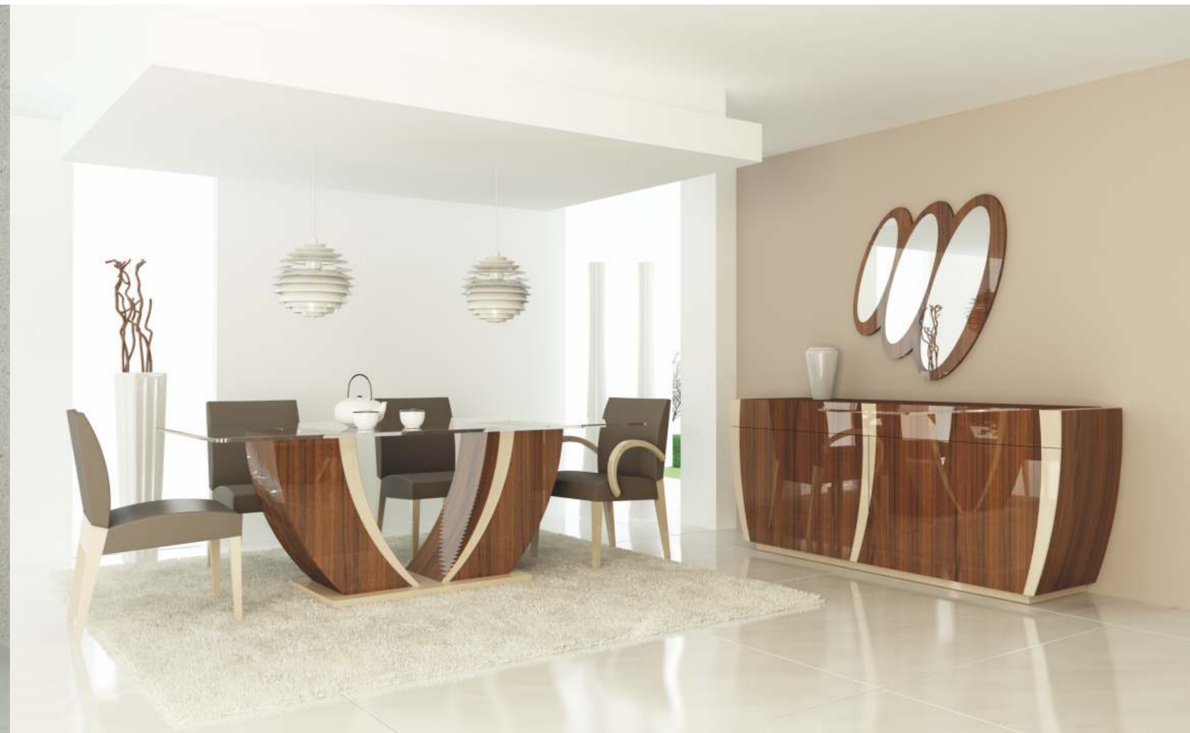
REF: FT19 DIM.: 480 x 570 x 830 mm