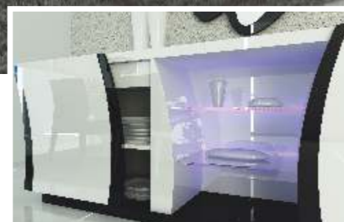
REF: FT14 DIM.: 2200 x 500 x 850 mm