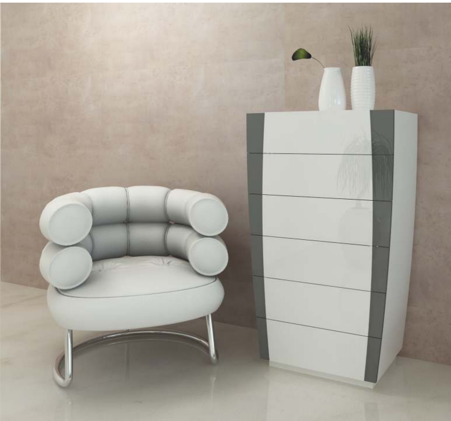
REF: FT28 DIM.: 700 x 450 x 1200 mm