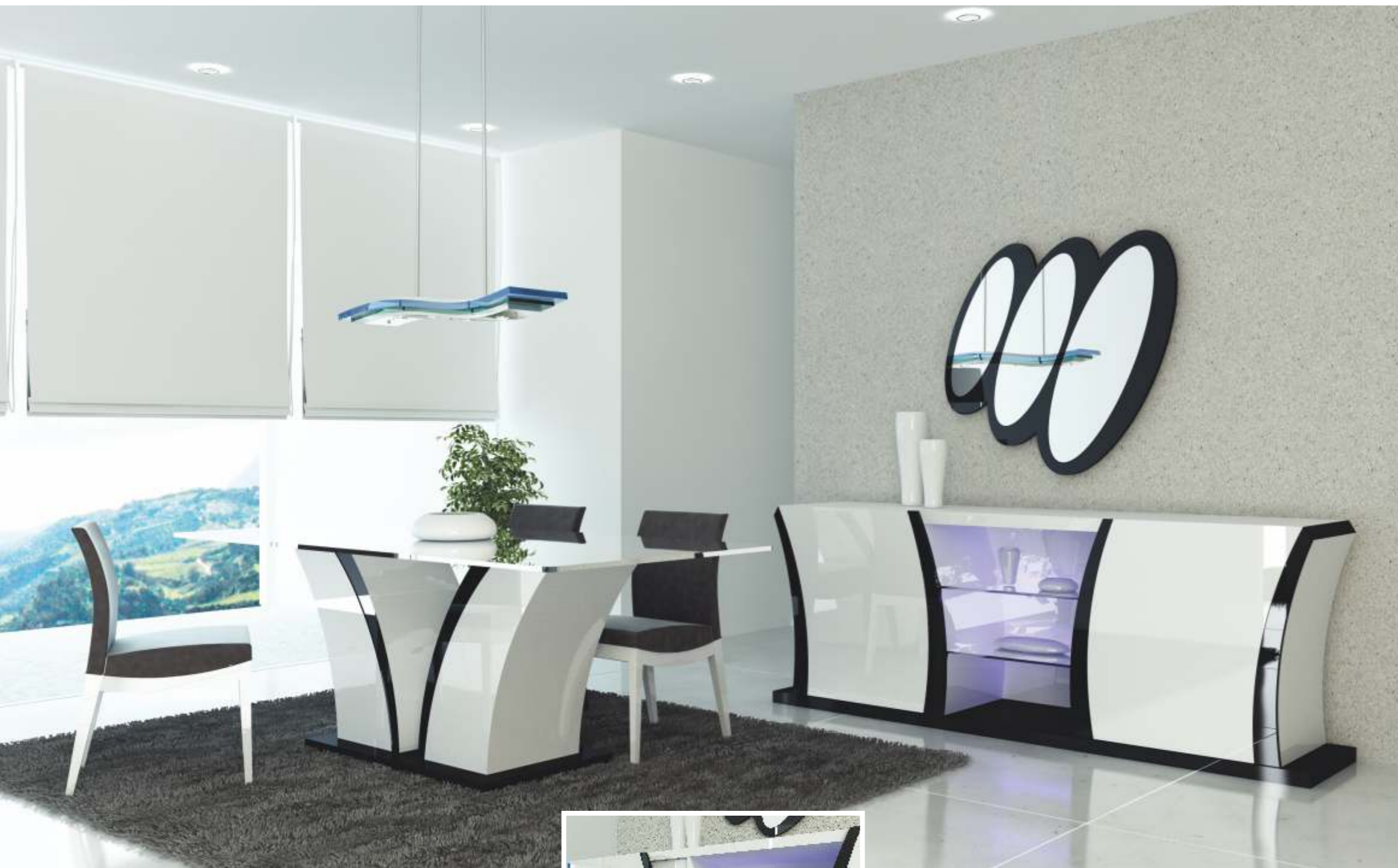
REF: FT20 DIM.: 470 x 570 x 855 mm