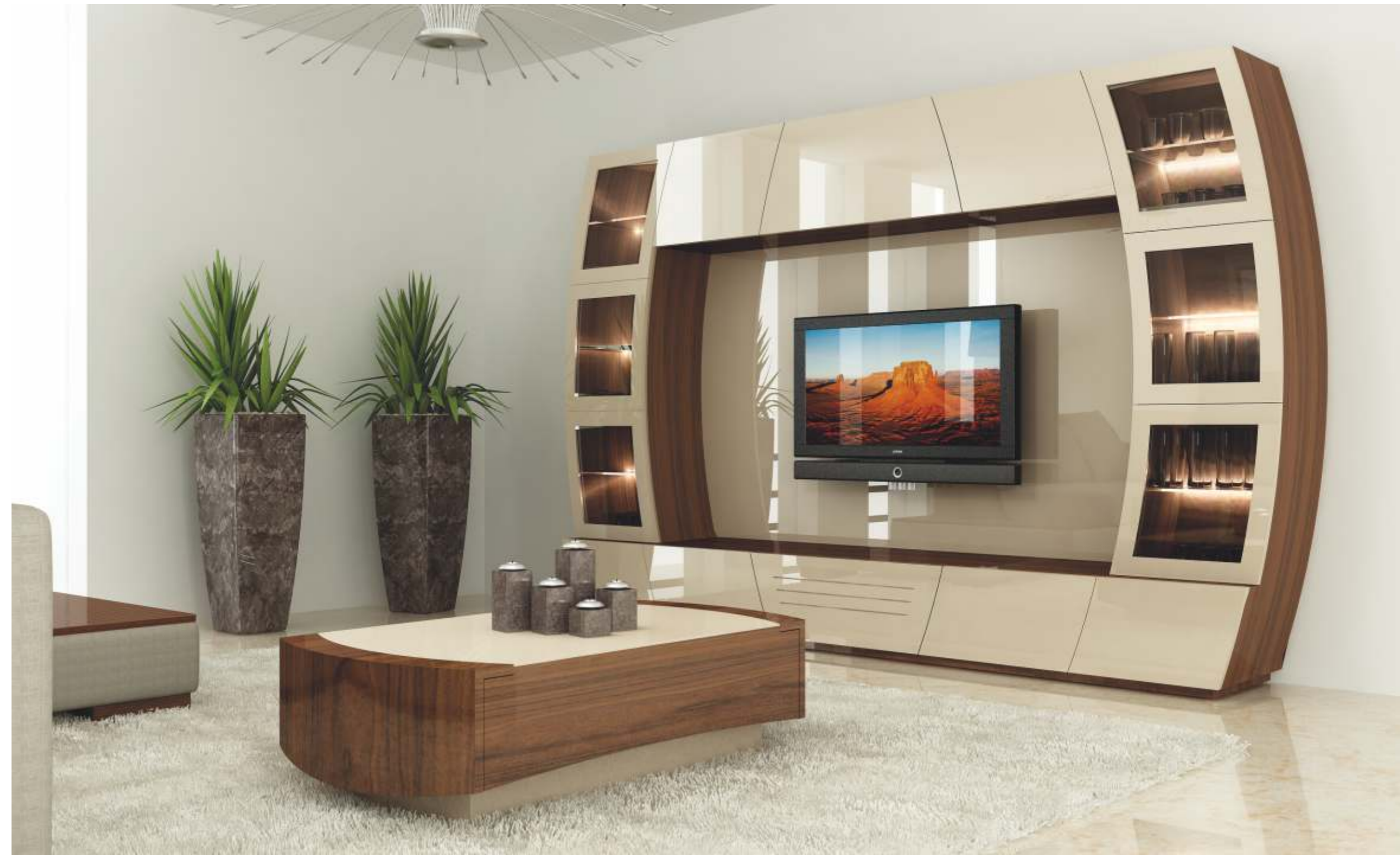
REF: FT09 DIM.: 1200 x 700 x 350 mm