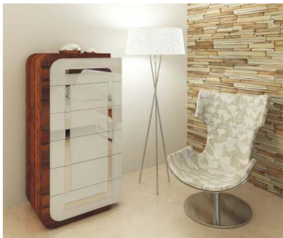
REF: FT34 DIM.: 700 x 455 x 1200 mm