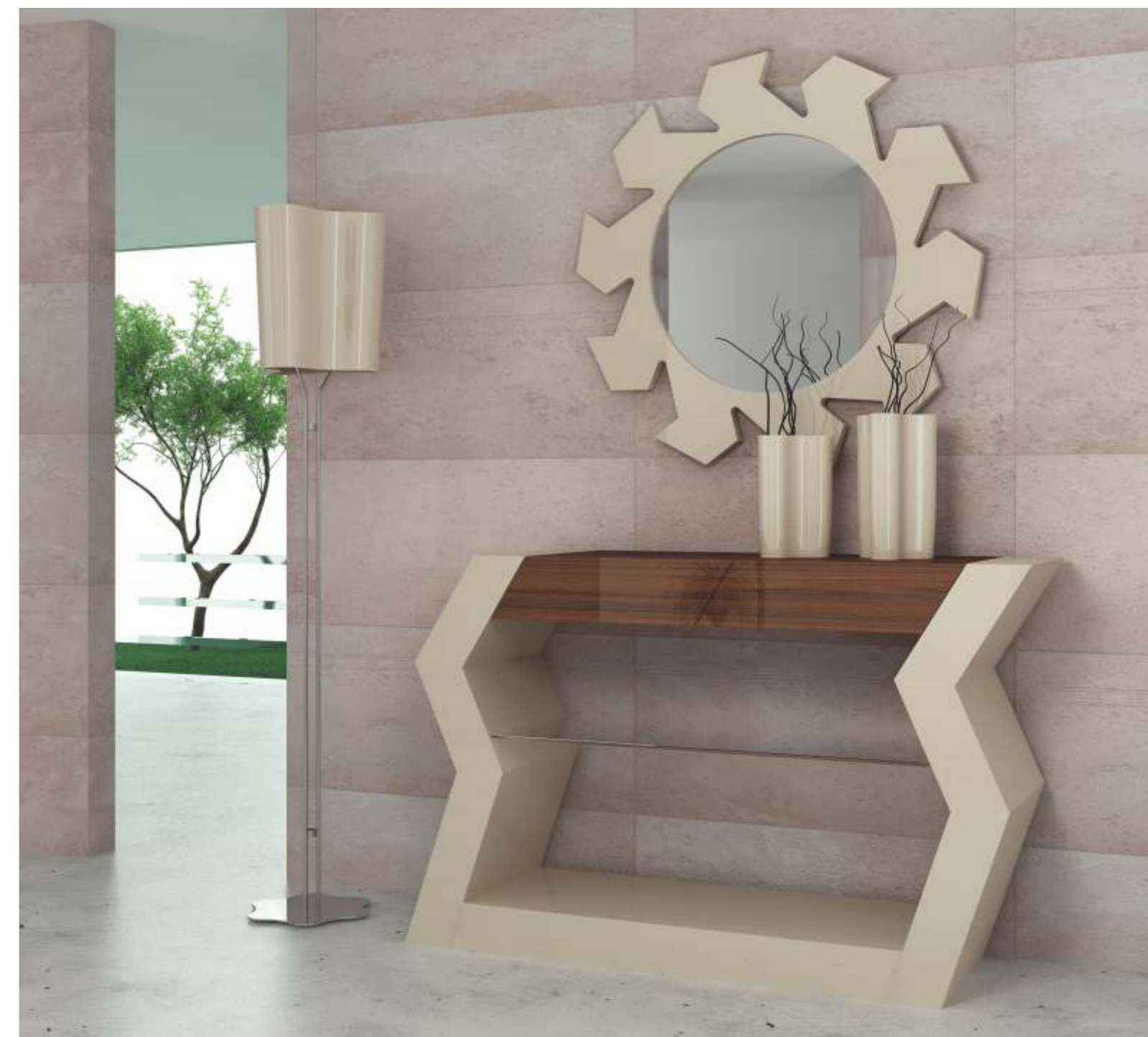
REF: ZA01 DIM.: 1275 x 370 x 820 mm