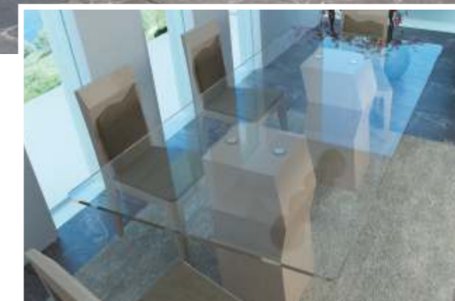
REF: ZA10 DIM.: 495 x 535 x 950 mm