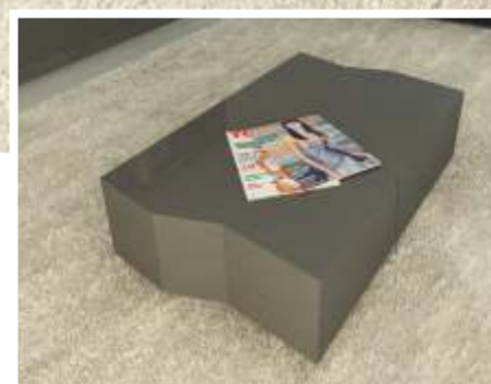
REF: ZA04 DIM.: 3000 x 470 x 1900 mm