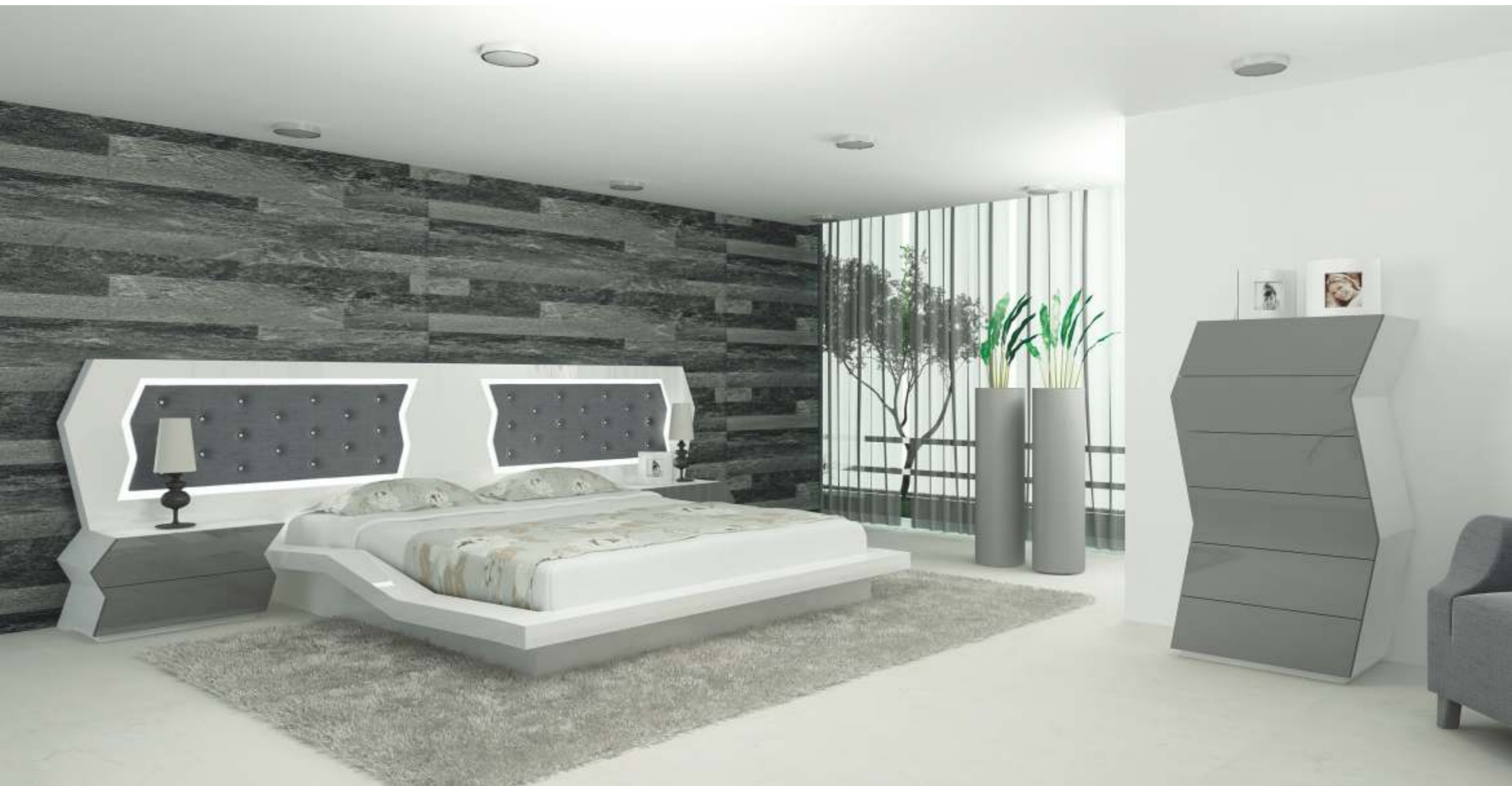
REF: ZA14 DIM.: 685 x 420 x 380 mm