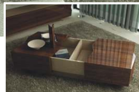
REF: ZA07 DIM.: 3000 x 470 x 1900 mm