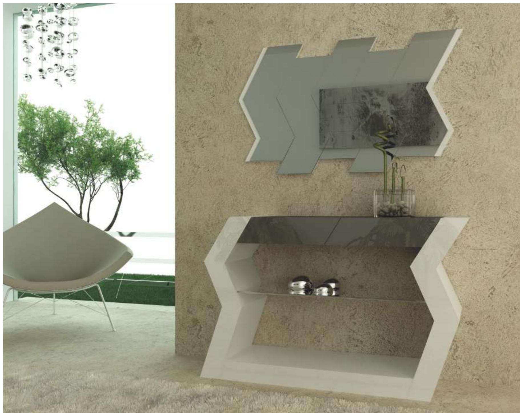
REF: ZA01 DIM.: 1275 x 370 x 820 mm