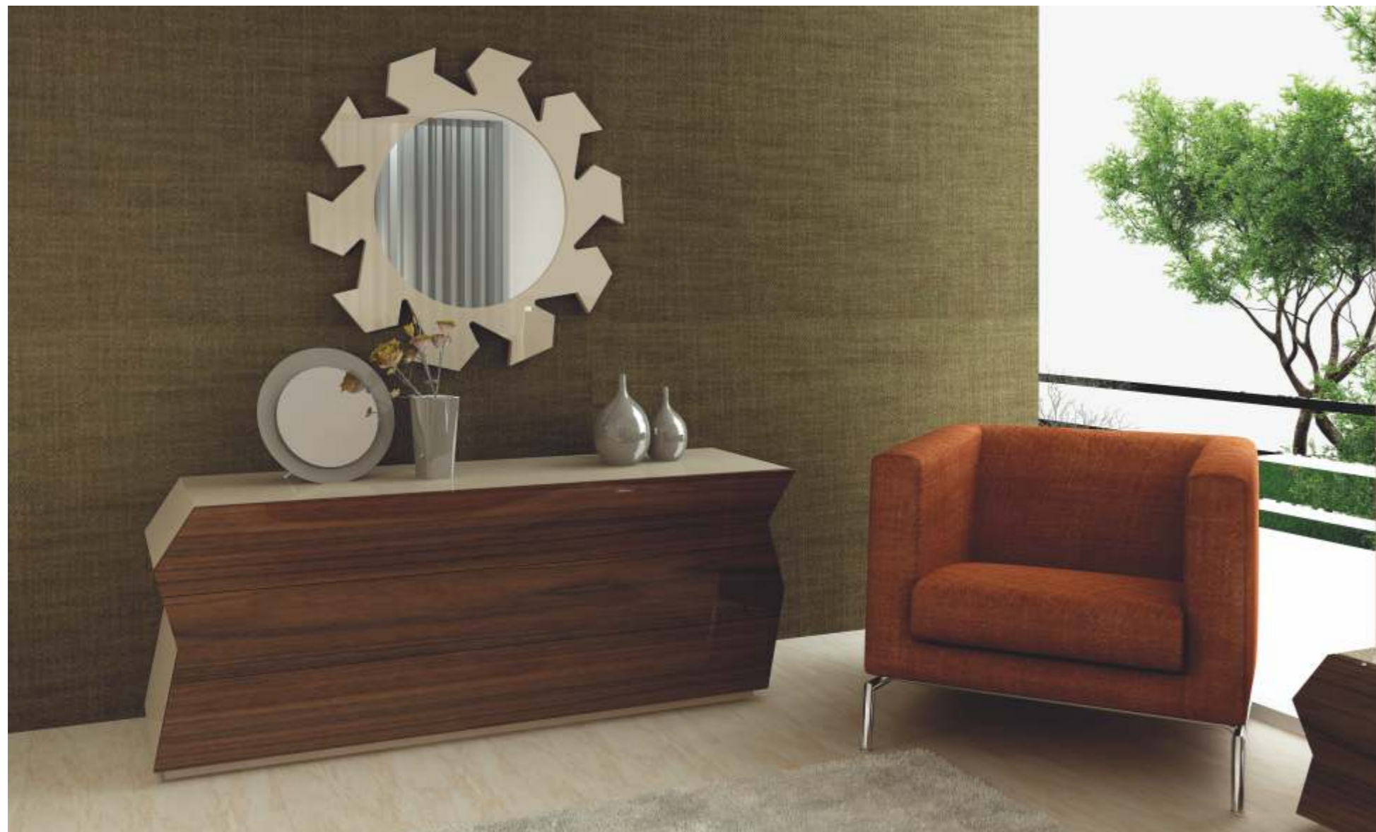
REF: ZA16 DIM.: 1600 x 500 x 600 mm