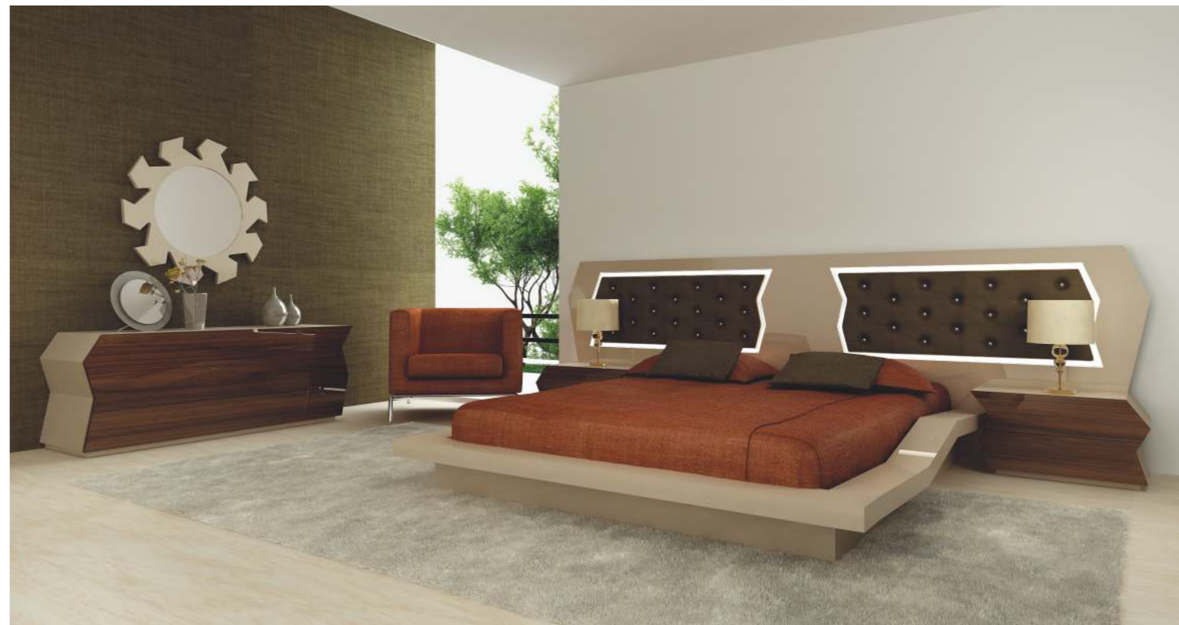
REF: ZA03 DIM.: Ø 900 x 30 mm